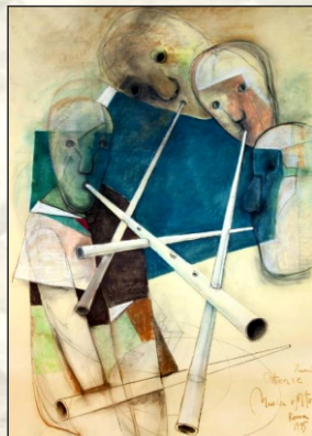
Stasys Eidrigevicius Muzyka i mit , 1995

Jeśli dodać do tego, że potrafił wyłócać się z radą parafialną, oczekującą prostych chorałowych przygrywek, o ukochaną przez siebie polifonię lub samowolnie przedłużać sobie urlop, by posłuchać mistrzowskiej gry Buxtehudego w Lubece, kreśli nam się obraz człowieka owładniętego muzyką. Jeśli do palety barw dodamy fakt, że miał dwadzieścioro dzieci, kochał piwo i inne trunki (w jednym z zachowanych kontraktów Bacha pisano, że za swoją